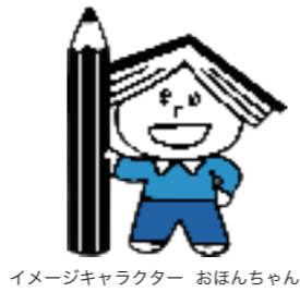
イメージキャラクター おほんちゃん

「読書感想文をどうやって書いたらいいかわからない」 「どんな本を読んだらいいかわからない」 そんな声にお答えします。 さあ、読書感想文にチャレンジしよう！