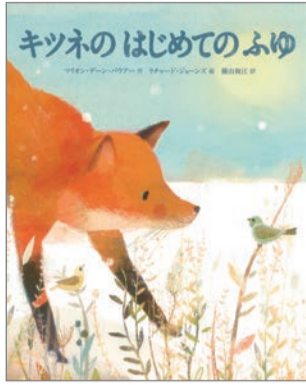
キツネのはじめてのふゆ マリオン・デー・パウアー 作 リチャード・ジョーンズ 絵 横山和江 訳 鈴木出版 1,500円