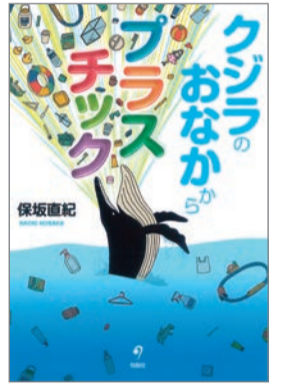
クジラのおなかからプラスチック 保坂直紀 著 旬報社 1,400円