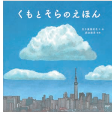
くもとそらのえほん 五十嵐美和子 作・絵 武田康男 監修 PHP研究所 1,300円