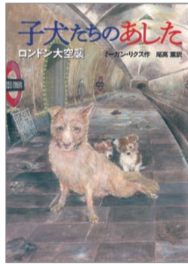
子犬たちのあした ：ロンドン大空襲 ミーガン・リクス 作 尾高 薫 訳 徳間書店 1,600円