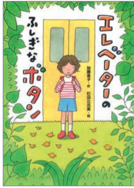
エレベーターのふしぎなボタン 加藤直子 作 杉田比呂美 絵 ポプラ社 1,000円