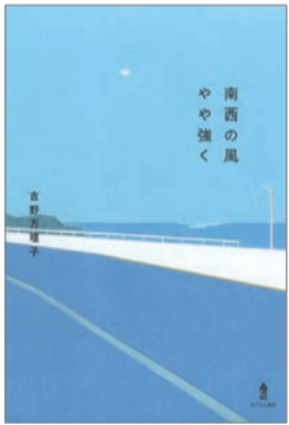
南西の風やや強く 吉野万理子 著 あすなる書房 1,400円