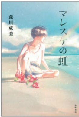
マレスケの虹 森川成美 作 小峰書店 1,500円