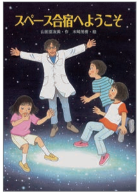
スペース合宿へようこそ 山田亜友美 作 末崎茂樹 絵 文研出版 1,300円