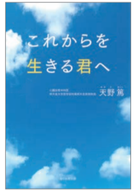
これからを生きる君へ 天野 篤 著 毎日新聞出版 1,200円