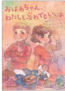
おばあちゃん、わたしを忘れてもいいよ 緒川さよ 作 久永フミノ 絵 朝日学生新聞社 1,200円