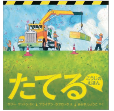
たてる サリー・サットン さく プライアン・ラブロック え あらやしょうこ やく 福音館書店 1,300円