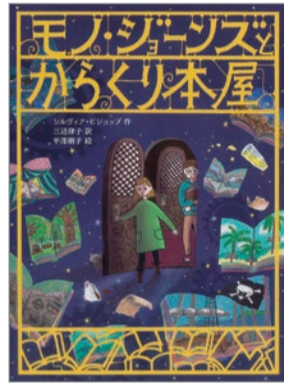
モノ・ジョーンズとからくり本屋 シルヴィア・ビショップ 作 三辺律子 訳 平澤朋子 絵 フレーベル館 1,400円