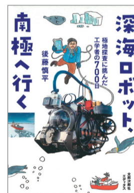
深海ロボット、南極へ行く :極地探査に挑んだ工学者の700日 後藤慎平 著 太郎次郎社エディタス 2,090円