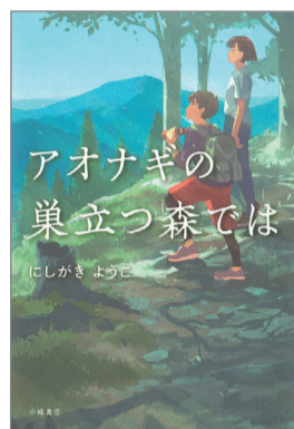
アオナギの巣立つ森では にしがきょうこ 作 小峰書店 1,760円