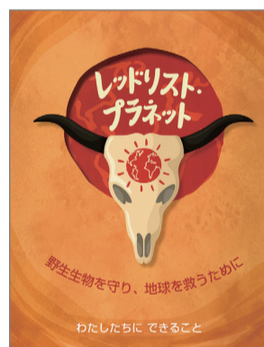
レッドリスト・プラネット :野生生物を守り、地球を救うために アンナ・クレイボーン 作 大山泉 訳 評論社 2,420円