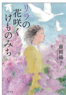
リラの花咲くけものみち 藤岡陽子 著 光文社 1,870円