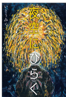
夜空にひらく いとうみく 著 アリス館 1,760円