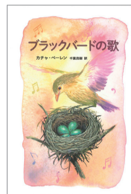
ブラックバードの歌 カチャ・ペーレン 著 千葉茂樹 訳 あすなる書房 1,650円