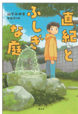
直紀とふしぎな庭 山下みゆき 作 もなか 絵 静山社 1,485円