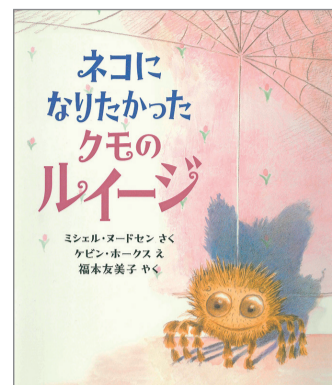
ネコになりたかったクモのルイージ ミシェル・ヌードセン さく ケビン・ホークス え 福本友美子 やく 岩崎書店 1,870円