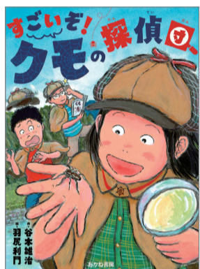
すでいぞ!クモの探偵団 谷本雄治 作 羽尻利門 絵 あかね書房 1,430円