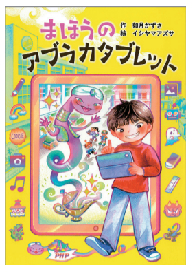
まほうのアブラカタブレット 如月かずさ 作 イシヤマアズサ 絵 PHP研究所 1,430円