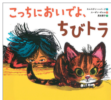
こっちにおいでよ、ちびトラ キルステン・ハバード 文 スーザン・ギャル 絵 長友恵子 訳 徳間書店 1,870円